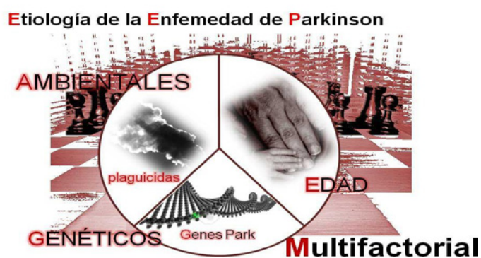
FIG. 2 - FATTORI IMPLICATI NELL'ORIGINE DEL PARKINSON

I fattori ambientali possono essere elementi che predispongono il Parkinson ma non ci sono studi appropriati di causa-effetto che possono confermare questa informazione, esiste per altro una ricerca sviluppata a Taiwan (Lee et al., 2016) dove viene messo in evidenza uno studio statistico; all'inizio dell'isorgenza del Parkinson nella popolazione